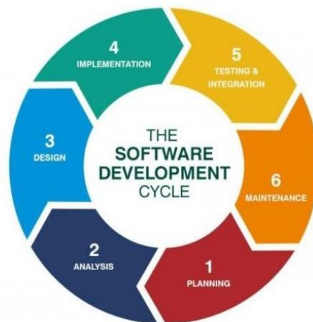
Gambar 10.1 Life Cycle

Analisis e-commerce juga melibatkan bekerja dengan TI dan rekayasa dalam pengembangan perangkat lunak dan internet yang sesuai life cycle. Hal ini membutuhkan tim analisis untuk berpartisipasi dan mungkin memimpin kegiatan teknis yang diperlukan untuk memberikan atau mendukung analisis, seperti pengumpulan data, ekstraksi, pemuatan, transformasi, tata kelola, keamanan, dan privasi. Bentuk life cycle yang digunakan e-commerce.